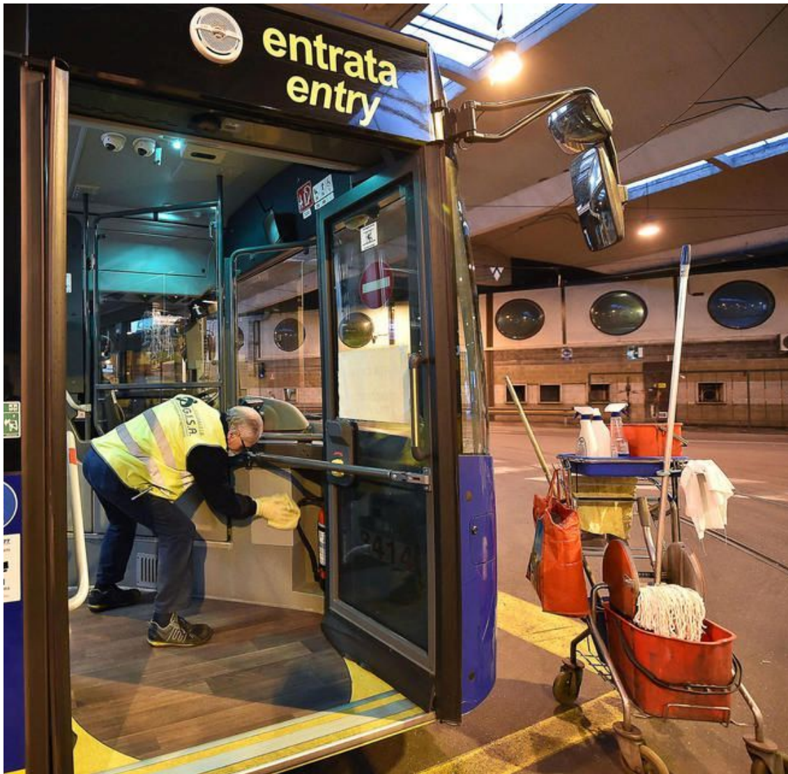
žuje vozilo.